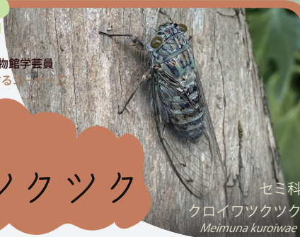
セミ科 クロイワツクツク Meimuna kuroiwae