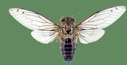
クロイワツクツク Meimuna kuroiwae