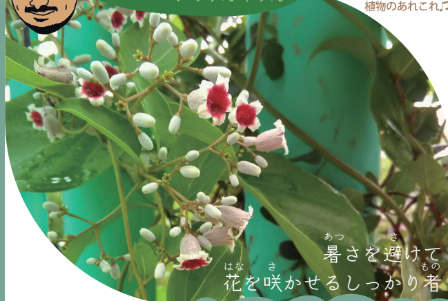
アカネ科 Paederia scandens